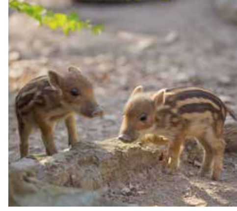
Frischlinge erkunden das Wildschweingehege.