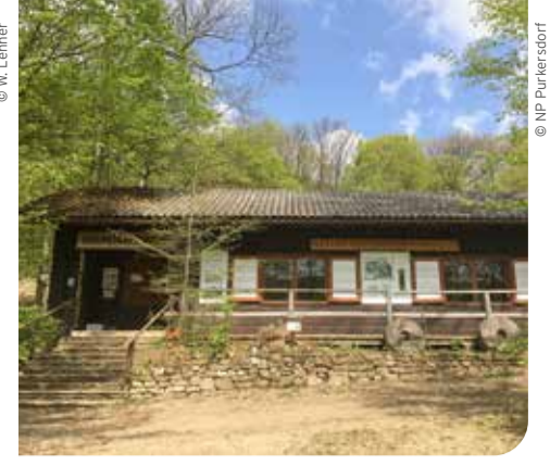
Herzstück des Naturparkzentrums ist das kleine Schaufenster-Museum, dessen Ausstellung von außen besichtigt wird.

Der Naturpark vor der Haustür und das grüne Vorzimmer Wiens