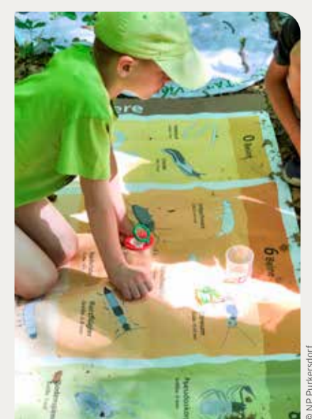
Die große Welt der sehr kleinen Bodentiere entdecken. Meist lichtscheu leisten sie für den Waldboden eine unverzichtbare Arbeit.

naturpark-purkersdorf.at/ erlebnisangebote-npp